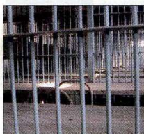
Se reintroducen medidas alternativas.

ENTRE sus prioridades destaca la lucha contra los delitos urbanísticos y las nuevas modalidades delictivas aparejadas al uso de las tecnologías. También se reintroducen algunas medidas alternativas a la pena de prisión eliminadas en la reforma del 2003. Introduce también la posibilidad de que una persona jurídica pueda ser autora de un delito.