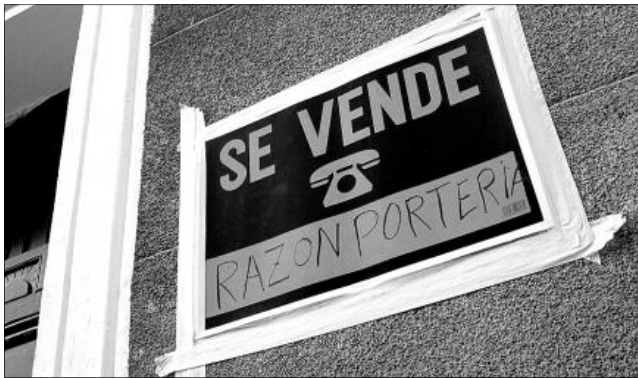
Imagen de un cartel de venta de un piso.